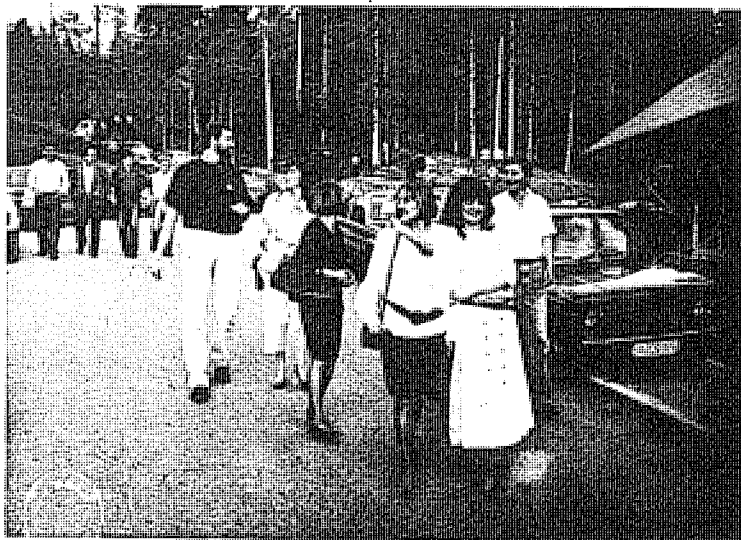
Slobodno vrijeme korišteno je za šetnju u prelijepim predjelima Igmana i Bjelašnice.