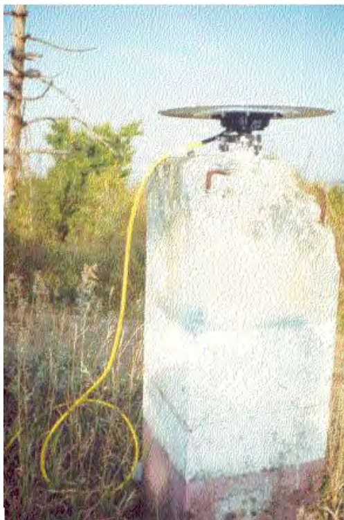
Sl.3. Antena na tački Stolice \Delta 377

U toku su završne pripreme za obradu podataka, koja prema planu, treba biti završena početkom 2001. godine.