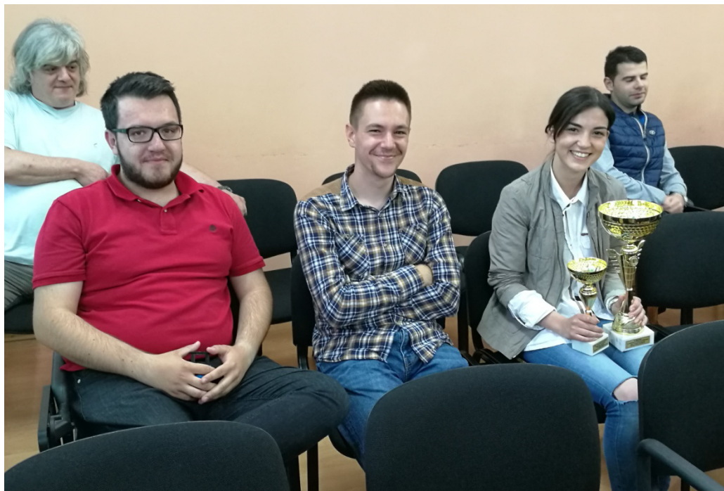
Slika 3. Predstavnici Asocijacije studenata Građevinskog fakulteta u Sarajevu sa priznanjima osvojenim na Građevinijadi 2018.

Hrasnicom, a zatim sponzora koji su prepoznali značaj ove manifestacije i podržali nas. Generalni sponzor ovo godine nam je Kanton Sarajevo, ali isto tako bez brojnih drugih sponzora i donatora ne bismo uspjeli da ostvarimo zacrtani cilj.