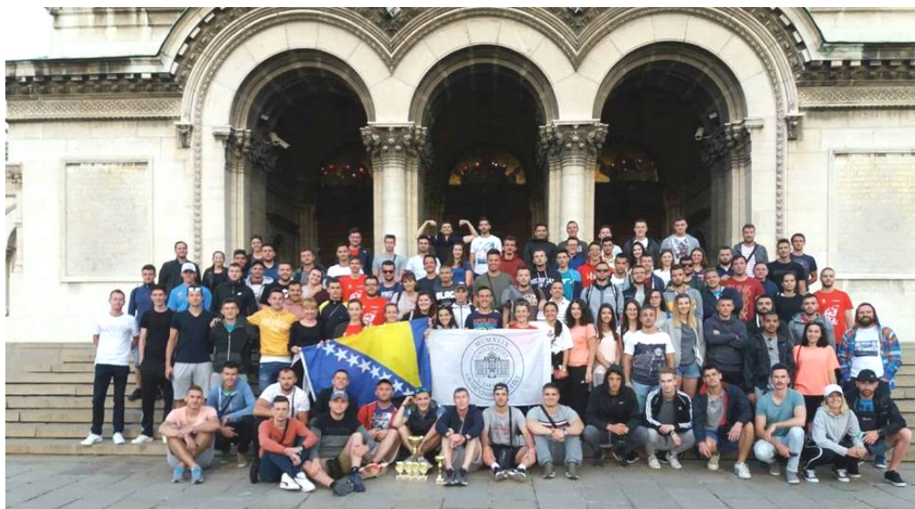
Slika 1. Ekipe Građevinskog fakulteta u Sarajevu na Građevinijadi 2018.

Studenti Građevinskog fakulteta Univerziteta u Sarajevu osvojili su prvo mjesto na 45. Građevinijadi, prvi put u historiji održavanja ove manifestacije. Naime, ovaj uspjeh je značajan iz razloga što je ovo prvi put da jedan fakultet sa Univerziteta u Sarajevu, ali i iz BiH općenito osvoji prvo mjesto na manifestacijama sličnog karaktera, koje su popularno nazvane „jadama“ i koje okupljaju studente istih ili srodnih zvanja.